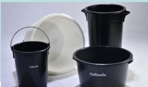
• Mengemmer •