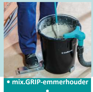
• mix.GRIP-emmerhouder •