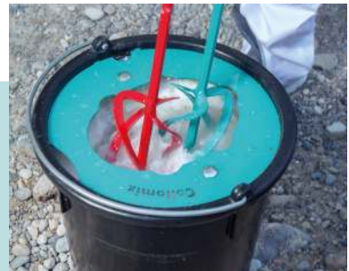
• MixerClean-reinigingsset •